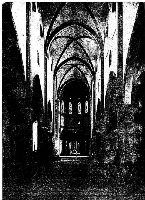
Nella Basilica di S. Francesco fu proclamato solennemente il Plebiscito

Interprete il Gioia, svolgendo il 2 novembre al Parlamento Subalpino una interpellanza circa le condizioni anormali della nostra città, in tanti modi vessata dal Thurn. Quell'interpellanza suscitò tanti consensi ed ebbe tali strascichi, che per poco non provocò la caduta del ministero Perrone-Pinelli.