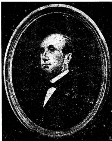
Conte BERNARDO PALLASTRELLI Storico delle giornate del '48 dalle colonne de «L'Eridano»

LA STORIA NARRERÀ QUESTO GIORNO X MAGGIO MDCCXLVIII IN CUI PIACENZA LIBERA E REDENTA PRIMA IN ITALIA CON MIRABILE CONSENSO DI TUTTI GLI ORDINI AGGREGANDOSI AL PIEMONTE FECE ATTO DI INAUGURARE L'UNITÀ E LA FUTURA GRANDEZZA DELLA NAZIONE