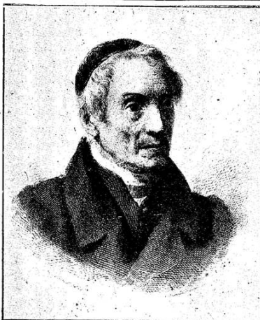
L'Ab. GIUSEPPE TAVERNA educatore delle generazioni del Risorgimento